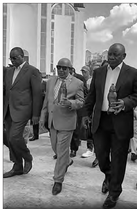
Коли верстався номер, деталі перемовин із Президентом Володимиром Зеленським відомі не були.

Раніше Посол України в ПАР Любов Абрамівна заявила, що Президент Володимир Зеленський «дуже чітко дав зрозуміти», що жодних переговорів між Києвом та Москвою не буде, поки російській військ не залишать територію України «в межах її міжнародно визнаних кордонів».